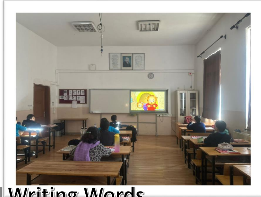
Watching Movies and Writing Words