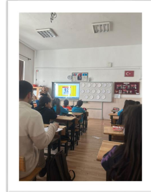
Time and Months